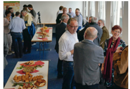
Fördermitgliedertreffen 2017 im Schulungsraum des GIH-Baden-Württemberg.

lung mit der Uni Kassel und dem BAFA beteiligt. Heute führt der GIH die Hälfte aller Quereinsteigerprüfungen durch.