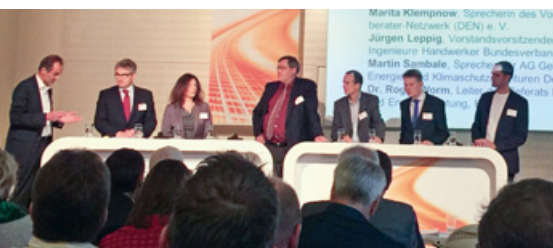
Der Bundesvorsitzende Jürgen Leppig auf dem Dena-Kongress 2014.