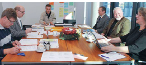
Der Vorstand tagt im Dezember 2010.