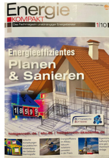
Die erste Ausgabe des GIH-Magazins Energie KOMPAKT.