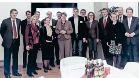
2015 erscheinen Umweltministerin Barbara Hendricks und Staatssekretär Thomas Barreiß zum Kamingespräch.