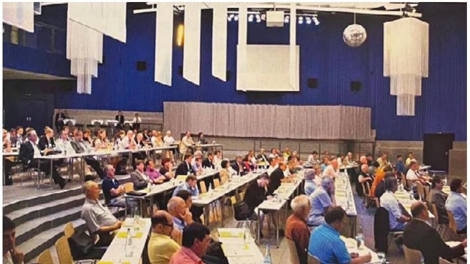
2011: Impressionen vom 1. Bundeskongress in Berlin.