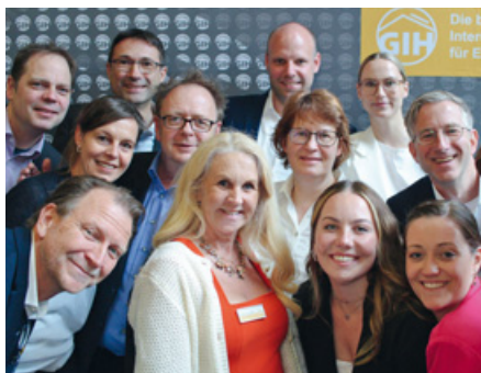
Mit der Größe und den Aufgaben des GIH wächst auch die Geschäftsstelle.

Mitgliederbereich, um alle relevanten Informationen an einem Ort bereitzustellen. Heute tauscht sich der GIH mit den Ministerien in politischen und fachlichen Fragen aus. Mit BAFA und KfW finden Quartalsgespräche statt. Er ist inhaltlich und fachlich eingebunden beim Dena-Kongress und auf vielen Messen in Deutschland. Das ist nur möglich, weil die Landesverbände in der Aus- und Weiterbildung sehr aktiv sind. Seit langem feste Größen im Kalender sind die Ost-Energietage , das Baye-rische Energieberatersymposium und das Süddeutsche Energieberaterforum . Auch in der öffentlichen Wahrnehmung trägt die Arbeit Früchte. „In den vergangenen Jahren hat sich der GIH konsequent professionalisiert und ist heute in Politik und Medien als zentraler Ansprechpartner